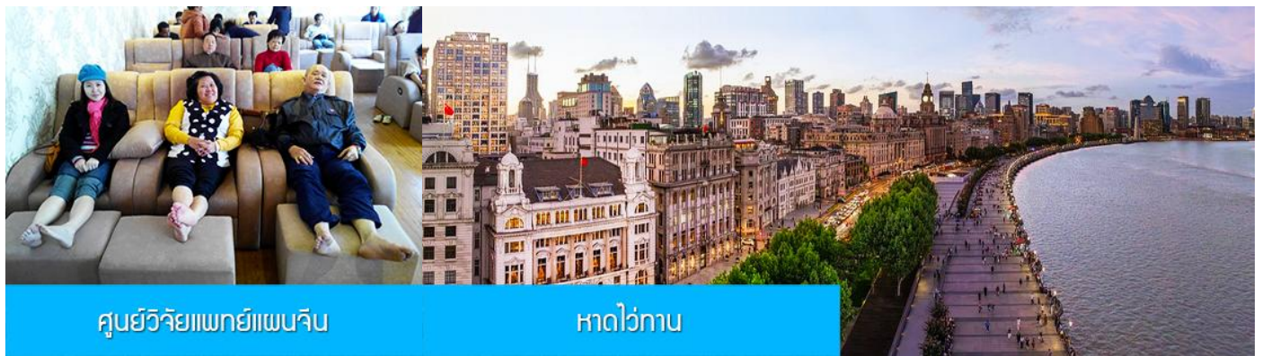
ศูนย์วิจัยแพทย์แผนจีน