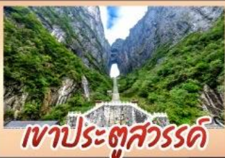
เขาประตูลสวรรค์