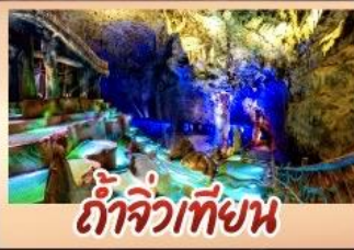
ถ้ำจิวเทียน