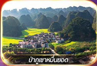
ป่าภูเขาหมื่นยอด