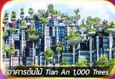
อาคารต้นไม้ Tian An 1,000 Trees