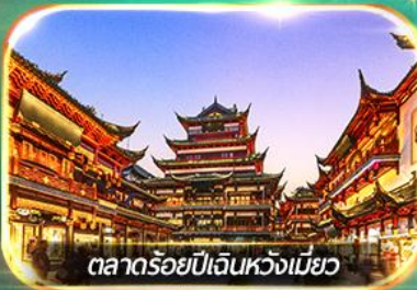
ตลาดร้อยปีเงินห้วงเมี่ยว