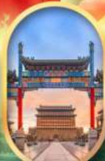
ถนนคนเดินเทียนเหมิน