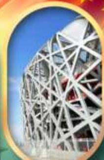
ผ่านชมสนามกีฬาาริงนก