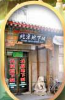
เมืองโบราณใต้ดิน