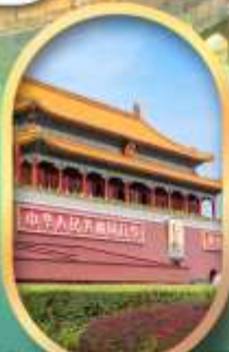
จัสมุทริสเทียนอันเหมิน