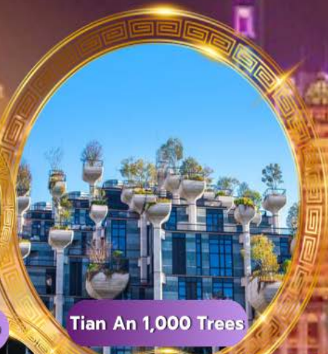
Tian An 1,000 Trees