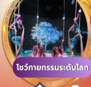
โชว์กายกรรมระดับโลก