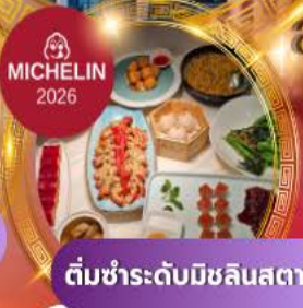
ติ่มซำระดับมิชลินสตาร์

สัมผัสทัศนียภาพเซี่ยงไฮ้ เช็กอินแลนด์มาร์คล้ำยุค ล่องเรือเมืองเก่าจู่เจียเจี้ยว พักหรู 5 ดาว ครบจบในทริปเดียว