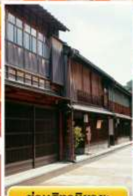
ย่านอิงาชิซายะ