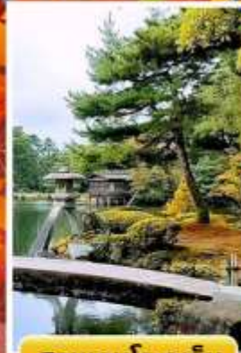
สวนเคนโระคุเอ็น

ออนเซ็น 3 คั้น มน.กระเป๋า 23 กก. 7Days 5Night