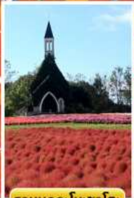
สวนบกกะโนะซาโตะ