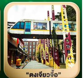
“ดงเจียวจื่อ”