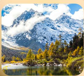
“ปี้ผิงโกว”

T2G-TFU25SL Basic Chengdu...เจิงตู สี่ครุณี ปี้ผิงโกว 4D 3N (SL)