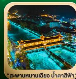
“สะพานหนานเฉียว น้ำคาสีฟ้า”