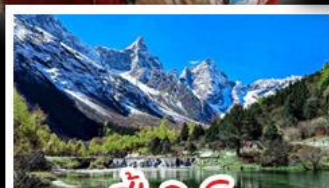
ปี่ผิงโกว