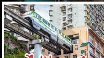
รถไฟไฟทะเลลุดัก