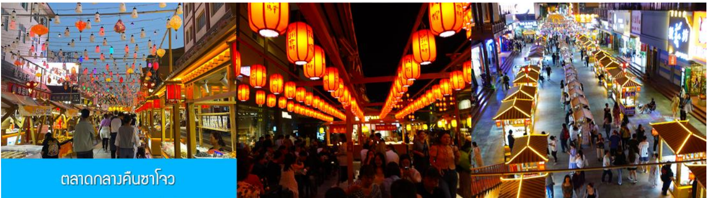
ตลาดกลางคืนซาโจว