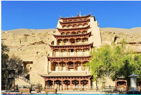
ถ้ำหินมั่วเกาถู

เช้า รับประทานอาหารเช้า ณ ห้องอาหารของโรงแรม (9)