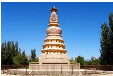
เจดีย์ม้าขาว

เที่ยง รับประทานอาหารกลางวัน ณ ภัตตาคาร (10)