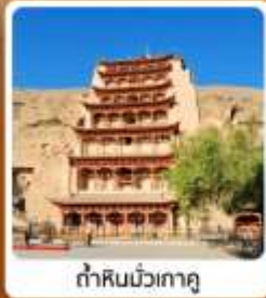
ตำหินมั่วเกาตุ