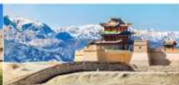
กำแพงเมืองจีน ด้านเจียอวี๋กวน

*ทางบริษัทฯ ขอสงวนสิทธิ์ในการสลับโปรแกรมทัวร์ตามความเหมาะสมขึ้นอยู่กับสถานการณ์หน้างาน โดยคำนึงถึงผลประโยชน์ของลูกค้าเป็นสำคัญ