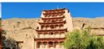
ถ้าแกะสลักม่อเกาคุ