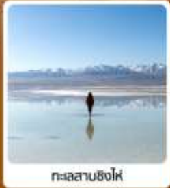
ทะเลสาบชิงไห่