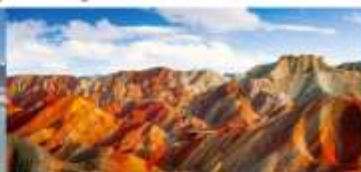
หุบเขาสายรุ้งจางเย่