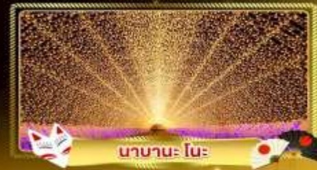
นานาะ โนะ