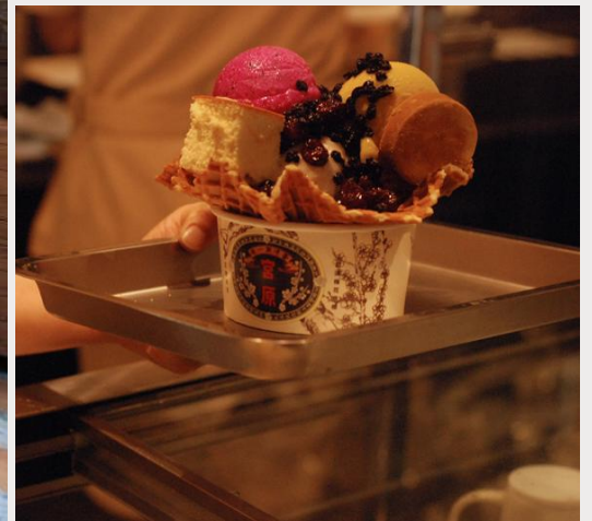
ร้านไอศกรีมมิยาฮาระ (Miyahara Ice cream)

นำท่านเดินทางสู่ ตลาดกลางคืนอี้จง (Yizhong Street Night Market) ที่นี้มีทั้งร้านอาหาร ของกิน ร้านเสื้อผ้า ร้านรองเท้า รวมไปถึงห้างสรรพสินค้า มีแต่ของกินของขึ้นชื่อที่ได้หวันเยอะแยะมากมาย ให้ท่านได้เลือกซื้อปเลือกซื้อกันได้ตามอัธยาศัย