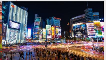
ตลาดกลางคืนซีเหมินตึง

*ทางบริษัทฯ ขอสงวนสิทธิ์ในการสลับโปรแกรมทัวร์ตามความเหมาะสมขึ้นอยู่กับสถานการณ์หน้างาน โดยคำนึงถึงผลประโยชน์ของลูกค้าเป็นสำคัญ