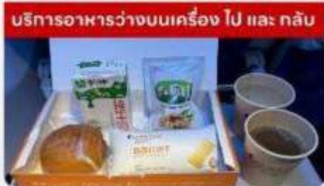
บริการอาหารว่างบนเครื่องบิน ไป และ กลับ