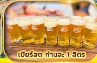
เบียร์สด ท่านละ 1 ลิตร