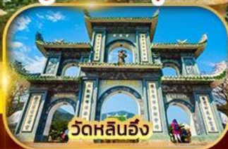
วัดหลินฮั่ง