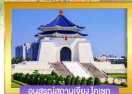
อนุสรณ์สถานเจียง ไคเชก