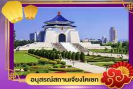
อนุสรณ์สถานเจียงไคเชก