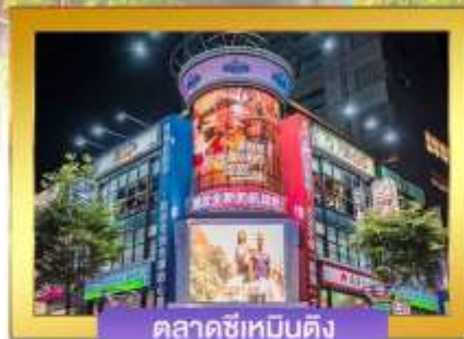
ตลาดซีเหมินติง