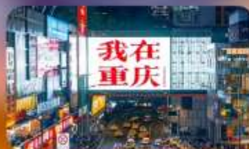
ถนนกวนอิมเฉียว