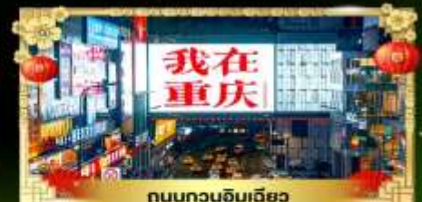
ถนนทวงฉิมเฉียว