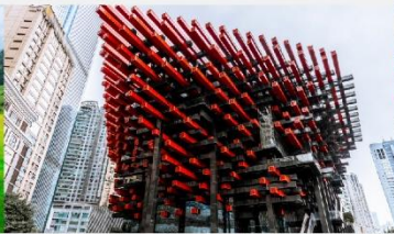
ตึกตะเกียบ