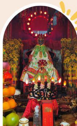
วัดเจ้าแม่กวนอิมอ่องฮำ ขอพรเรื่องเงิน ทรัพย์สิน และความมั่งคั่ง