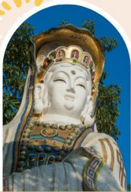
ริพลัสเบย์ รับพลังงานดี เสริมพลังฮวงจุ้ย

"ไหว้พระ เสริมดวง เพิ่มสิริมงคลแก่ชีวิต"