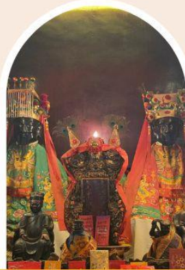
วัดหม่านโหมว การศึกษา การงาน สติปัญญา