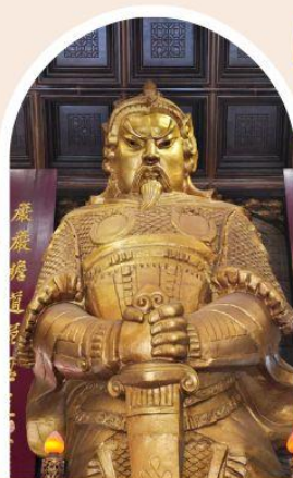
วัดแซกง ขอพรโชคลาง การเงิน และธุรกิจ