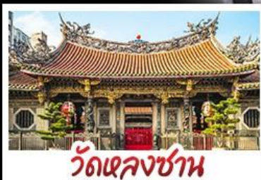
วัดเลงชาน