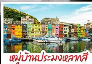
หมู่บ้านประมงเหลากสี