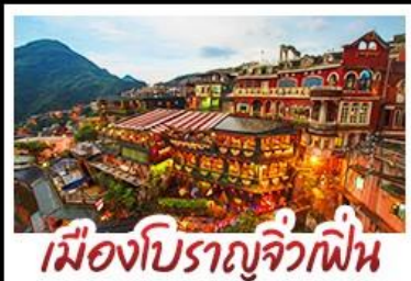
เมืองโบราณจิ่วเฟิ่น