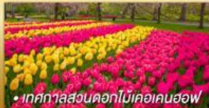
• เทศกาลสวนดอกไม้เคอเคนฮอฟ