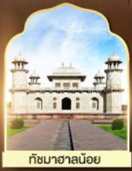
ถ้ำมาชานน้อย