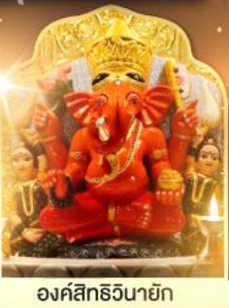
องค์สิทธีวินายิก