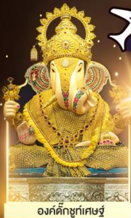
องค์ตั้งบูชท์พิเศษ