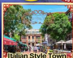
Italian Style Town