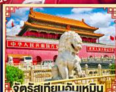
จัตุรัสเทียนจันเหมิน