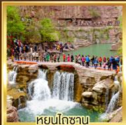
หยุ่นโกซาม