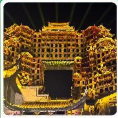
ตึกหัตถกรรม 72

• ไฮไลท์ อุทยานเทียนเหมินซาน ประตูสวรรค์ ตึกหัตถกรรม 72 หมู่บ้านโบราณฟูรงเจิน ภูเขาไร่ชาอู่จี้ไฮโด อุทยานสื่อจื่อกวนด่านสิงโต