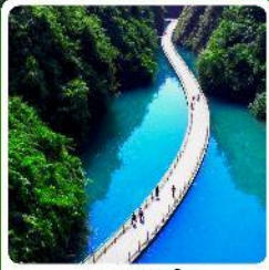
หุบเขาสิงโต