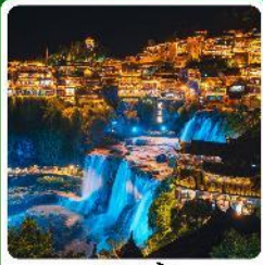
ฟูรงเจิน