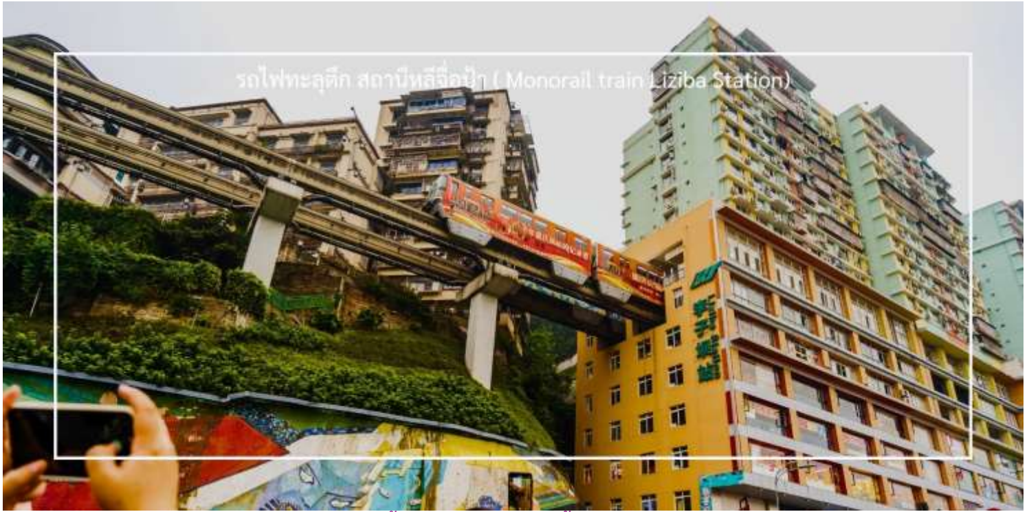
รถไฟทะลุตึก สถานีหลี่จื่อป้า ( Monorail train Liziba Station)

เย็น บริการอาหารเย็น ณ ภัตตาคาร (เมื่อที่ 7) เมนูพิเศษ : สุกี้หม่าล่า