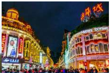
ถนนคนเดิน จวซาลู่