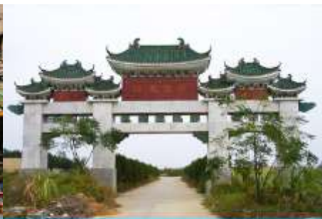
สุสานพระเจ้าตากสิน