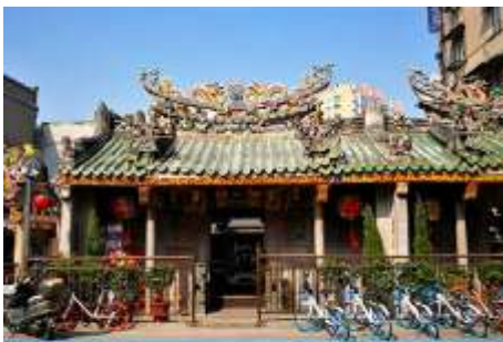
ศาลเจ้าแม่ทับทิม

พักที่ โรงแรม Kyriad Marvelous HOTEL 4* หรือเทียบเท่าในซัวเถา