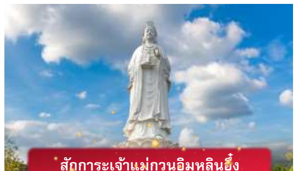
สักการะเจ้าแม่กวอนอิมหลินอึ้ง