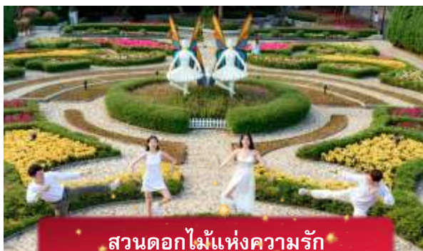
สวนดอกไม้แห่งความรัก