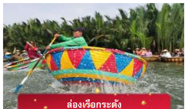
ล่องเรือกระดิ่ง

เช้า บริการอาหารเช้า ณ ห้องอาหารของโรงแรม นำท่านเดินทางสู่ หมู่บ้านกัมทาน เพื่อนำท่าน ล่องเรือกระดิ่ง หมู่บ้าน เล็กๆในเมืองฮอยอันตั้งอยู่ในสวนมะพร้าวริมแม่น้ำ ในอดีตช่วงสงคราม หมู่บ้านแห่งนี้เคยเป็นที่พักอาศัยของทหาร อาชีพหลักของคนที่นี่หมู่บ้านแห่ง นี้คือประมง ระหว่างการล่องเรือท่านจะได้ชมวัฒนธรรมของชาวบ้าน ณ หมู่บ้านแห่งนี้ สามารถให้ทิปได้ตามความพอใจของท่าน จากนั้นนำท่านเดินทางสู่ เมืองโบราณฮอยอัน เมืองมรดกโลกที่ยังคง เอกลักษณ์และรักษาวัฒนธรรมไว้อย่างดีเยี่ยม โดยท่านสามารถเดินเล่น ถ่ายรูป ตามตรอกซอกซอยต่างๆ ได้ ไฮไลท์ของการมา ถ่ายรูปเช็คอินที่นี้คือการได้ขึ้นไปถ่ายรูปจากมุมสูงของคาเฟ่ที่อยู่ตามซอกซอย ได้ทั้งวิว ได้ทั้งชิมกาแฟรสชาติออริจินัลของเวียดนาม