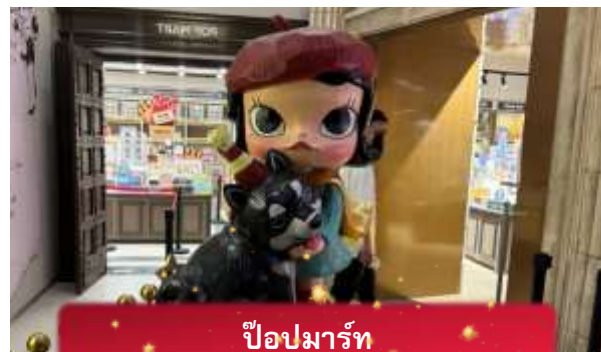
ป๊อปมาร์ท