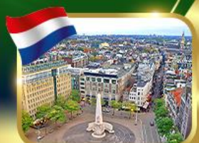
จัตุรัสดันสแควร์ อัมสเตอร์ดัม