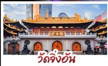
วัดจิ่งอัน