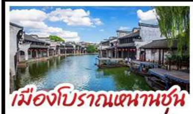
เมืองโบราณหนานชุน

DISNEYLAND SHANGHAI เต็มวัน เมืองโบราณหนานชุน (รวมล่องเรือ) - วัดจิ่งอัน เมืองโบราณหนานชุน - ตลาดร้อยปีเฉิงหวังเหมียว มือพิเศษ บุฟเฟ่ต์ BBQ, เสี่ยวหลงเปา