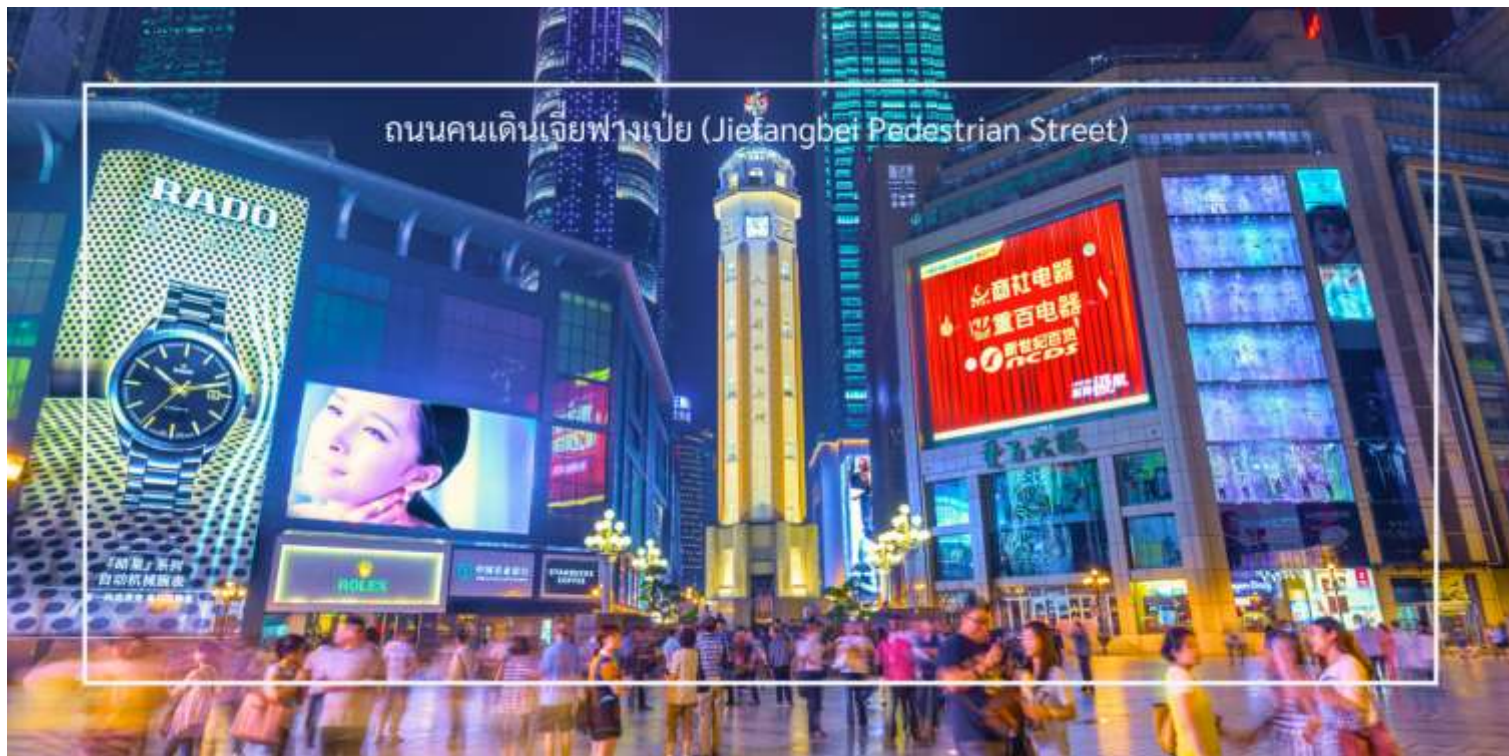
ถนนคนเดินเจียงเป่ย์ (Jiefangbei Pedestrian Street)

และการแสดงต่างๆ ที่ทำให้บรรยากาศน่าสนใจยิ่งขึ้น และยังเต็มไปด้วยร้านค้าแบรนด์เนม ร้านค้าท้องถิ่น และตลาดที่ขายสินค้าต่างๆ เช่น เสื้อผ้า เครื่องประดับ และของที่ระลึก แวะชมร้าน POP MART ร้านดังจากจีน ที่รวมฟิกเกอร์ดีไซน์เก๋และตุ๊กตาน่ารักหลากหลายซีรีส์ยอดนิยม เช่น Molly, Dimoo, Labubu และอีกมากมาย ที่สายสะสมของเล่นไม่ควรพลาด