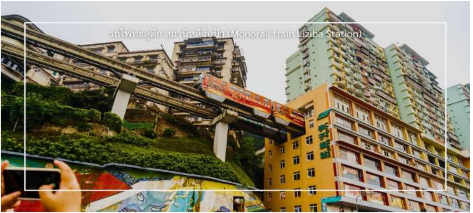
รถไฟเหาะลัดก สถานีหลี่จื่อป้า (Monorail train Liziba Station)

จากนั้นเดินทางไปยัง ตลาดหงหยาดัง (Hongyadong) หรือที่เรียกว่า "Hongya Cave" เป็นสถานที่ท่องเที่ยวที่มีชื่อเสียงในเมืองฉงชิ่ง โดยตั้งอยู่ริมแม่น้ำแยงซี มีบรรยากาศที่เต็มไปด้วยวัฒนธรรมและประวัติศาสตร์ ตลาดหงหยาดังเป็นพื้นที่ที่มีอาคารแบบดั้งเดิมที่สร้างขึ้นในสไตล์สถาปัตยกรรมแบบซิโน-ทิเบต โดยมีร้านค้า ร้านอาหาร และบาร์จำนวนมาก ที่นี่ท่านสามารถลิ้มลองอาหารรสเด็ดและชมพื้นเมืองอื่นๆที่ขึ้นชื่อ ตลาดหงหยาดังยังมีวิวทิวทัศน์ที่สวยงามสามารถเดินเล่นตามทางเดินที่มีการจัดแสดงงานศิลปะและสินค้าท้องถิ่น