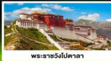
พระราชวังโปตาลา