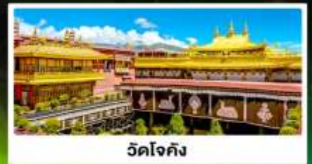
วัดโจกิง