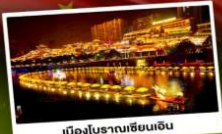
เมืองโบราณเซียนเิน

เที่ยว 2 เมือง จางเจียเจีย & เอนซือ ล่องเรือแคนยอนผิงซาน เทียบหุบเขาอวตาร