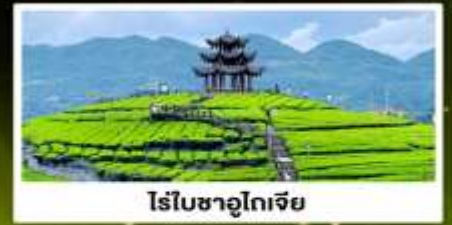
ไร่ชาอู๋เจีย