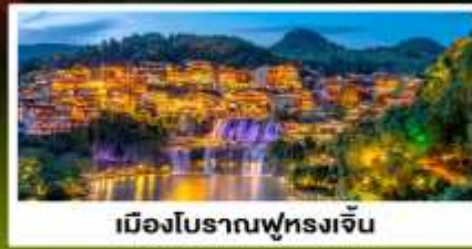
เมืองโบราณฟุทงเจิ้น