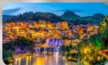
เมืองโบราณฟุทงเจิน