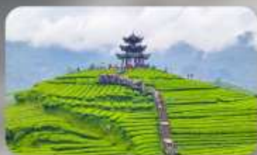
กูเจาไร่ชาอู๋เจียโก