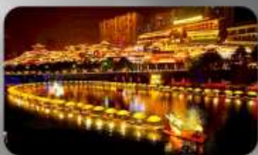
เมืองโบราณเซียนเอน