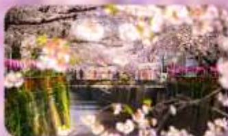
MEGURO RIVER SAKURA