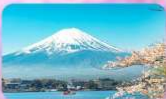
KAWAGUCHIKO SAKURA SPOT