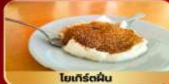
โยเกิร์ตผืน