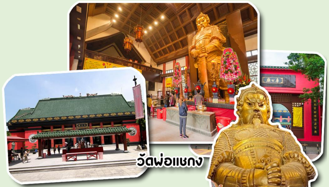
วัดพ่อแชกง