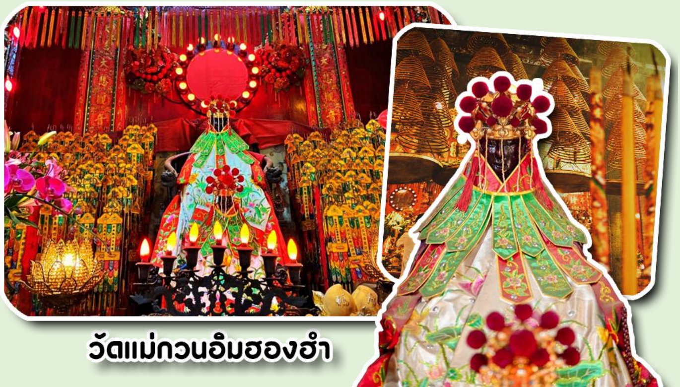
วัดแม่กวนอิมฮองฮำ

พาท่านเข้าชม ร้าน D-DRAX ชมกังหันน้ำโซค ทำกังหันทุกชิ้นวางตามหลักฮวงจุ้ยโดยซินแซ ผ่านพิธีจากวัดแซงทมิว ฮ่องกง โดยได้ชื่อ ที่ทำพิธีใหญ่ให้ อยากเฮง อยากรวย มีสิ่งดีๆเสริมฮวงจุ้ย ตัวโบพัดกังหันหมุนได้รอบทิศทาง หมุนไปมาตามการเคลื่อนไหวของร่างกาย ด้วยความเชื่อที่ว่า กังหันช่วยหมุนชีวิตพลิกผัน จากร้ายกลายเป็นดี จะช่วย "ช่วยดึงดู นำพาสิ่งดีๆเข้ามาในชีวิต บัดเป่าสิ่งไม่ดีพัดออกไป" พาชีวิตราบรื่น เจริญก้าวหน้า ทั้งหน้าที่การงาน โชคลาภ เงินทองวง รับทรัพย์เหมือนกังหันที่ลู่ลม และพาท่านเข้าชม ร้านหยก ชมความงามปีเซี่ยะที่เชื่อกันว่า ใครมีไว้บูชาเงินทองจะไหลมาไม่ขาดสายและมีจำหน่ายยาสมุนไพรบำรุงเพิ่มความแข็งแรง