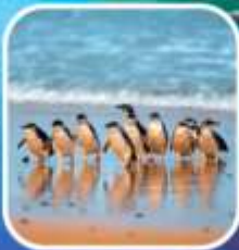
เพนกวินที่เกาะฟิลลิป