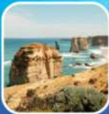
Great Ocean Road (ครึ่งสาย)