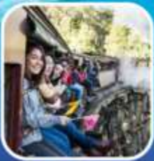
รถไฟจักรไอน้ำโบราณ