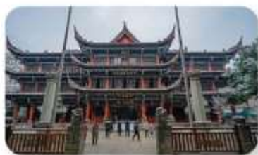
วัดเหวินซู