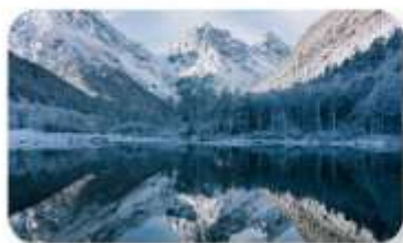
ปี้ฝิงโกว