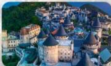
Ba Na Hills