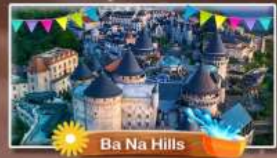
Ba Na Hills