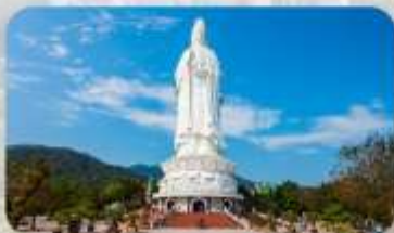
วัดลินห์อิ่ง