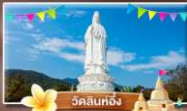
วัดลินห์ฮิ่ง