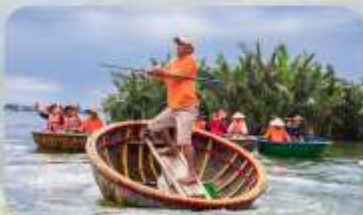
นั่งเรือกระด้ง

Mercury Bana Hill French Village บานาฮิลล์