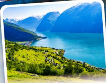
ช่องฟยอร์ด