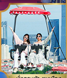
นั่งกระเช้า ชมเมือง