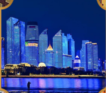
หาดโซเบอร์ฟังก์