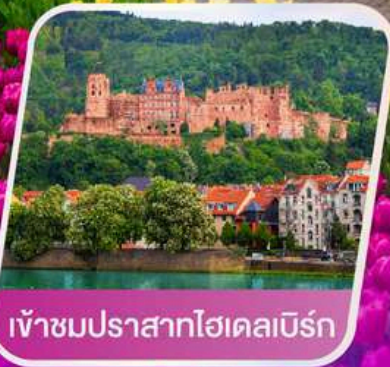
เข้าชมปราสาทไฮเดลเบิร์ก