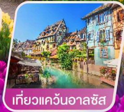
เที่ยวแคว้นอาลซัส