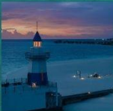
Light House Restaurant